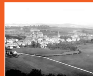
Panorama van Mersch (1900)