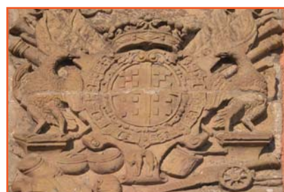
Wapenschilden van de Graaf von Elter