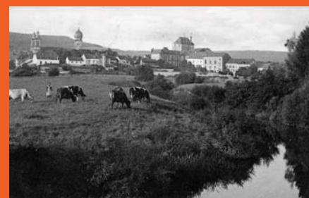
Afbeelding uit 1920