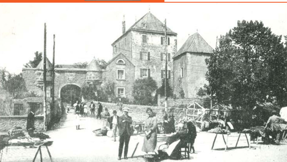
Marktdag in Mersch rond 1910

Deze middeleeuwse burcht met zijn vier ronde torens van 6 meter doorsnede besloeg een oppervlak van 34 x 30 meter. De burchttoren werd in een latere bouwfase aan de noordwestelijke kant uitgebreid, wat blijkt uit