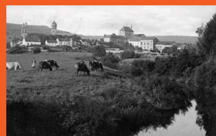
Vue en 1920