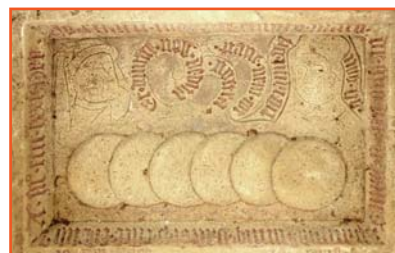
Table d'aumônes (1500)