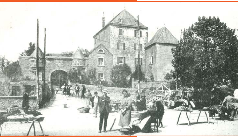
Jour de marché à Mersch vers 1910

COMMUNE DE MERSCH Château de Mersch Tel.: 32 50 23 - 1